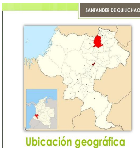
Santander de Quilichao en Colombia