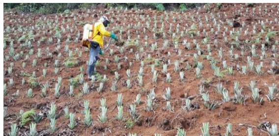
Comunidad rural vereda san pedro en Santander de Q