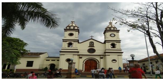
Comunidad urbana Iglesia San Antonio de Padua Santander de Q

-De estas fotografías ¿Cuál corresponde a un paisaje urbano y cuál a uno rural?